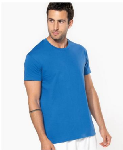
20.3032 | Kariban

Pánské a dámské tričko z těžké bio bavlny Materiál: 185g/m 2 , 100% certifikovaná bio bavlna. Rovný střih, bez bočních švů, kulatý výstřih z žebrovaného úpletu, dvojitý ozdobný šev ve výstřihu, krční lemovka tón v tónu, dvojitě švy na rukávech a lemu, vegan, neutrální velikostní štítek, prátelné na 40°, nelze sušit v sušičce, nelze chemicky čistit velikosti: XXS – 5XL Základní cena: XS-XXL – 90,- Kč/kus