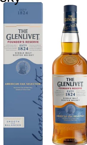
80GLTRES Glenlivet Founders Reserve 0,7l

Obsah alkoholu: 46,33 % Objem: 0,05 L Dárkový degustační set prémiové irské whiskey Writers Tears, 3 x 50ml. Ochutnejte provedení Copper Pot, Double Oak a Cask Strength. Vynikající dárek pro milovníky whisky. Dárkový degustační set prémiové irské whiskey Writers Tears, 3 x 50ml. Ochutnejte provedení Copper Pot, Double Oak a Cask Strength. 566,- Kč/kus