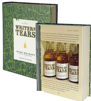
80WTB002 Writers Tears Mini Book 3 x 50ml

Obsah alkoholu: 46,33 % Objem: 0,05 L Dárkový degustační set prémiové irské whiskey Writers Tears, 3 x 50ml. Ochutnejte provedení Copper Pot, Double Oak a Cask Strength. Vynikající dárek pro milovníky whisky. Dárkový degustační set prémiové irské whiskey Writers Tears, 3 x 50ml. Ochutnejte provedení Copper Pot, Double Oak a Cask Strength. 566,- Kč/kus