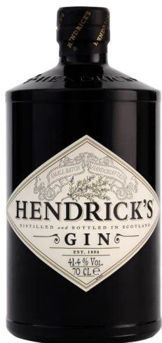
80HEN070 Hendrick's Gin 0,7l Obsah alkoholu: 41,4 % Objem: 0,70 L

Hendrick's gin je gin vyráběný v malých sériích, destilovaný ve skotské přímořské vesnici Girvan. Je plněn do lahví, připomínající staré lékárenské dózy a je ideální k míchání Gin & Tonic. Unikátní, skvěle vybalancovaná chuť v sobě jako jediná spojuje chuť okurky a esence okvětních lístků růží. Jediný gin na světě, který je destilován pomocí dvou destilačních zařízení - destilační kolona Bennet z roku 1860 produkuje velmi robustní a chutově bohaté destiláty a destilační zařízení Carter (1948) zase osvěžující a neuvěřitelně delikátní lihoviny.