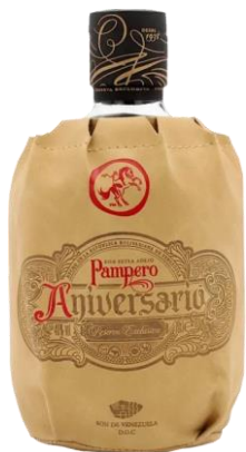
80PAN070 Pampero Aniversario Ron Extra Añejo, Reserva Exclusiva 0,7l

Pampero Aniversario je směs rumů původem z Venezuely, které zrají 4 – 6 let. Díky kombinaci vysokých venezuelských teplot a vlhkosti Pampero rychleji vyzrává, výsledná chuť je výrazná a silná. Proto se doporučuje pít čistý nebo s ledem. Původně byl namíchán pouze v limitované edici na oslavu založení firmy (odtud název Aniversario). V roce 2007 získal dvě zlaté medaile a byl vyhlášen nejlepším rumem na San Francisco World Spirits Competition. 598,- Kč/kus