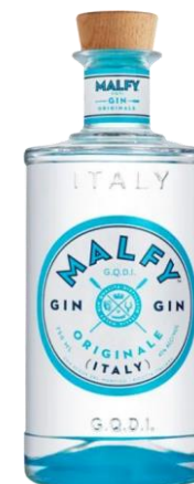
MGO070 Malfy Gin Originale 0,7l Italský prémiový gin. Jako ingredience pro výrobu se používá toskánský jalovec, koriandr a dalších 5 tajných Botanicals z vrcholu hory Monvisto. Při destilaci používá výrobce horskou pramenitou vodu, citronovou kůru ze Sicílie a Amalfinského pobřeží. 632,- Kč/kus