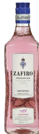
80ZFS070 Zafiro Pink Premium Gin Strawberry 0,7l Zafiro je středomořský růžový gin, jehož chuť je vybroušena velmi pečlivým výběrem použitých botanicals (byliny, koření, ovoce). Má velmi intenzivní aroma, v němž lze rozpoznat zejména jalovec, bílé květy, citrusové plody a jemné tóny jahod. V chuti je jemný a elegantní, s jasnými citrusovými a jalovcovými tóny a příjemnou jahodovou koncovkou. Doporučujeme pít jako long drink v kombinaci s limetkou a sodou nebo tonikem. 285,- Kč/kus

Zafiro je středomořský gin, jehož chuť je vybroušena velmi pečlivým výběrem použitých botanicals (rostliny, koření, ovoce). Má velmi intenzivní aroma, v němž lze rozpoznat zejména jalovec, bílé květy a citrusy. V chuti je jemný a elegantní, s citrusovými a jalovcovými tóny s přiměřenou intenzitou. Doporučujeme jako long drink v kombinaci s limetkou a sodou nebo tonikem. 285,- Kč/kus