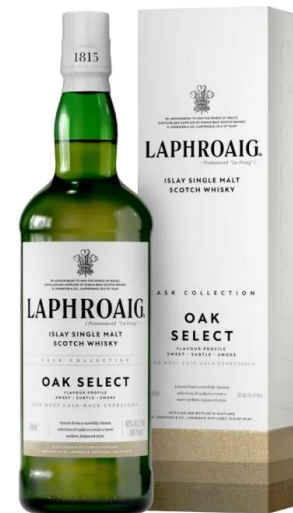
80LSL070 Laphroaig Select 0,7l