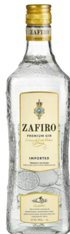
80ZFC070 Zafiro Classic gin 0,7l Obsah alkoholu: 37,5 % Objem: 0,70 L

Zafiro je středomořský gin, jehož chuť je vybroušena velmi pečlivým výběrem použitých botanicals (rostliny, koření, ovoce). Má velmi intenzivní aroma, v němž lze rozpoznat zejména jalovec, bílé květy a citrusy. V chuti je jemný a elegantní, s citrusovými a jalovcovými tóny s přiměřenou intenzitou. Doporučujeme jako long drink v kombinaci s limetkou a sodou nebo tonikem. 285,- Kč/kus