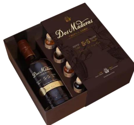
8098013 Dos Maderas P.X. 5+5 0,7l, degustační Degustační sada Dos Maderas 5+5 obsahuje Dos Maderas P.X. 5+5 0,7l a čtyři lahvičky 2,2 cl. Jsou to vzorky všech důležitých ingrediencí, které se podílejí na vzniku Dos Maderas 5+5. 1157,- Kč/kus

Pampero Aniversario je směs rumů původem z Venezuely, které zrají 4 – 6 let. Díky kombinaci vysokých venezuelských teplot a vlhkosti Pampero rychleji vyzrává, výsledná chuť je výrazná a silná. Proto se doporučuje pít čistý nebo s ledem. Původně byl namíchán pouze v limitované edici na oslavu založení firmy (odtud název Aniversario). V roce 2007 získal dvě zlaté medaile a byl vyhlášen nejlepším rumem na San Francisco World Spirits Competition. 598,- Kč/kus