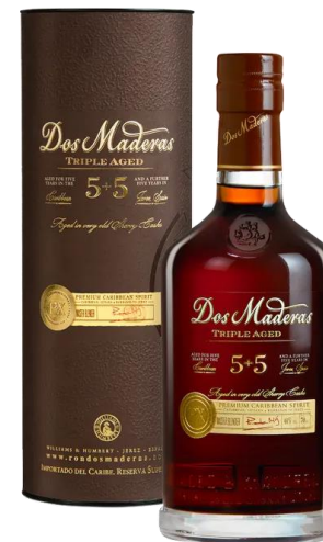
8098003 Dos Maderas P.X. 5+5 0,7l box Obsah alkoholu: 40 % Objem: 0,70 L Prémiový blend karibských rumů. Zrání je rozděleno do tří fází. Prvních 5 let zraje v dubových sudech přímo v Karibiku. Poté je převezen do Španělska, kde zraje ve sklepích vinařství Williams & Humbert. Nejdříve 3 roky v sudech po suchém sherry Dos Cortados a na závěr 2 roky v sudech po sladkém sherry Don Guido z odrůdy Pedro Ximénez. Dos Maderas 5+5 má harmonickou vůni s dotekem hroznů a fíků. Chuť je velmi jemná, komplexní a hřejivá. 1157,- Kč/kus